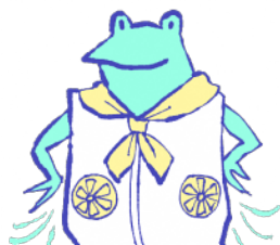
ファン付きウェア、 ネッククーラー