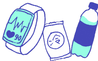
ウェアラブル端末、 応急セット