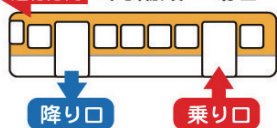
進行方向 1両編成の場合