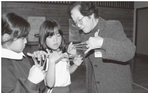
▲中央小学校で楽しく交流 (ゆうゆう講座)