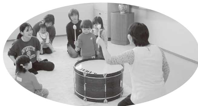
▲子育て応援セミナーでの1コマ

子育てはたいへんな仕事です。 何事も一人で解決しようとしなくて、 お気軽にご利用ください。 子育て支援センターは、ゆとりのあるのびのびとした子育てができるよう、お手伝いしていきます。