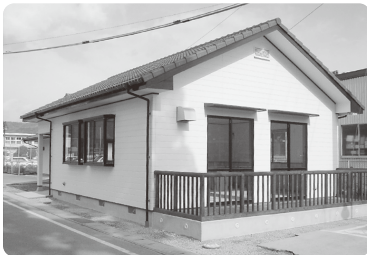
▲4月オープン予定の子育て支援センター