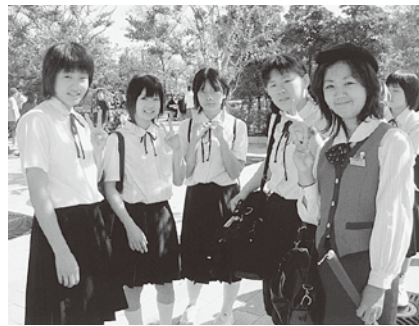
▲バスガイドさんといっしょに(島地中)