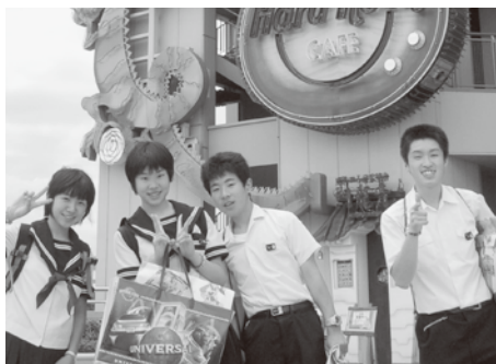
▲ユニバーサルスタジオにて(柚野中)

柚野中学校修学旅行 5月28日から2泊3日で、京都・大阪方面に行きました。京都・大阪では、主に市内自主研修をし、大阪では「なんばグランド花月」とユニバーサルスタジオジャパンで大都会の雰囲気を楽しみました。