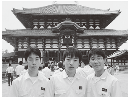
▲奈良の東大寺を見学(堀中)

5月27日から2泊3日で関西方面に行きました。奈良では有名な法隆寺・東大寺を見学し、京都では市内班別自主研修、大阪ではユニバーサルスタジオジャパンで大いに楽しい時間を過ごしました。