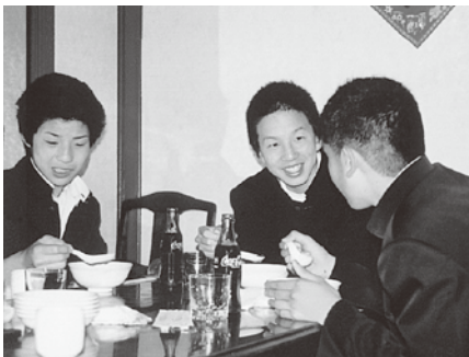
▲神戸でおいしい中華料理を(八坂中)

5月8日から2泊3日で神戸・京都・大阪方面に行きました。神戸では、阪神・淡路大震災後に設置された「人と防災未来センター」を見学し、京都では市内班別自主研修、大阪ではエキスポランドで楽しみました。