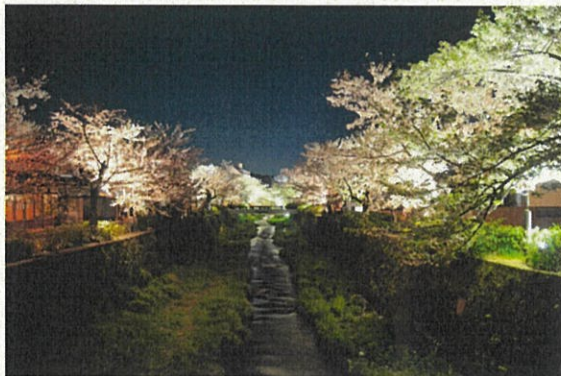
過去の一の坂川沿い桜並木のライトアップの様子