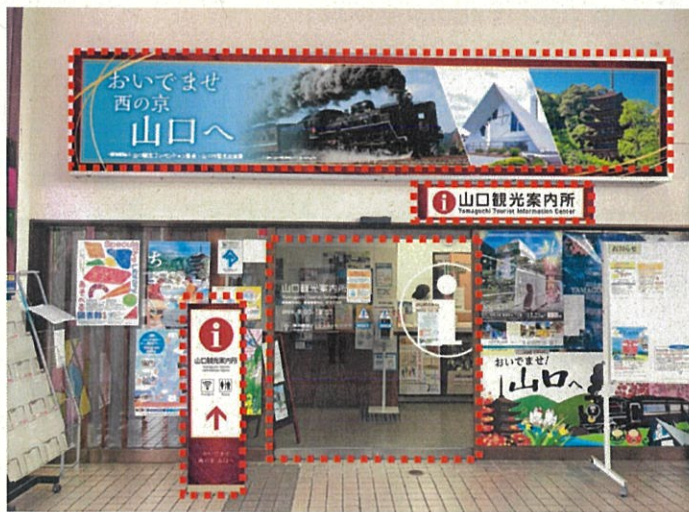
( がリニューアル後のイメージです。)

なお、デザインは、大内文化特定地域におけるサイン整備の際に用いられた、大内塗の朱を取り入れたデザインを基調としています。