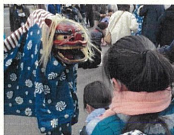
獅子舞の披露（2023年の様子）