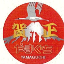
オリジナルヘッドマーク

※運行に関する情報は、SL やまぐち号公式サイト https://www.c571.jp をご覧ください。