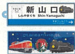
乗車限定ノベルティ