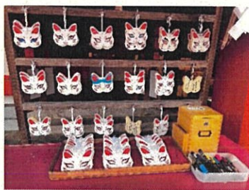
太鼓谷稲成神社のきつね絵馬