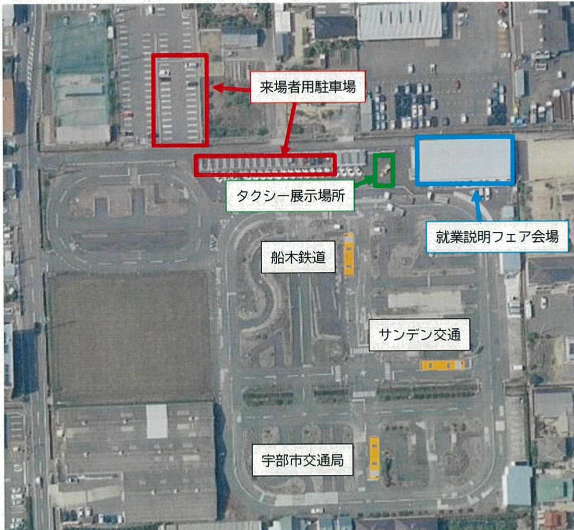
会場図及びバス運転体験実施図