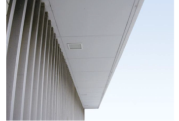
クリソタイル（白石綿）