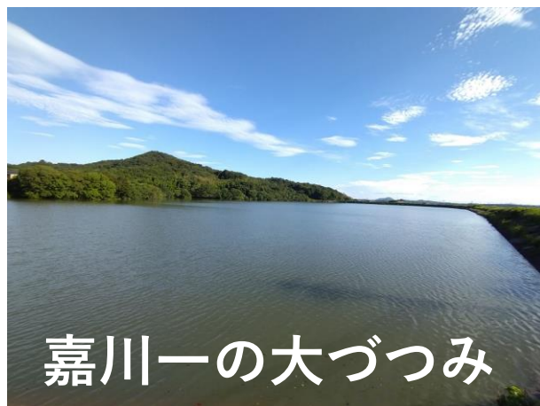
嘉川一の大づつみ