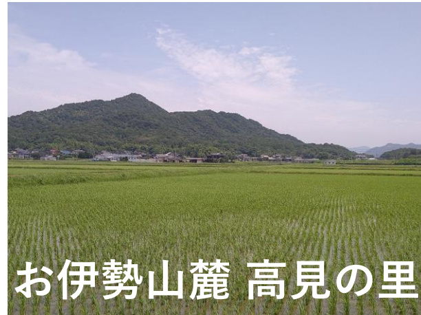
お伊勢山麓 高見の里