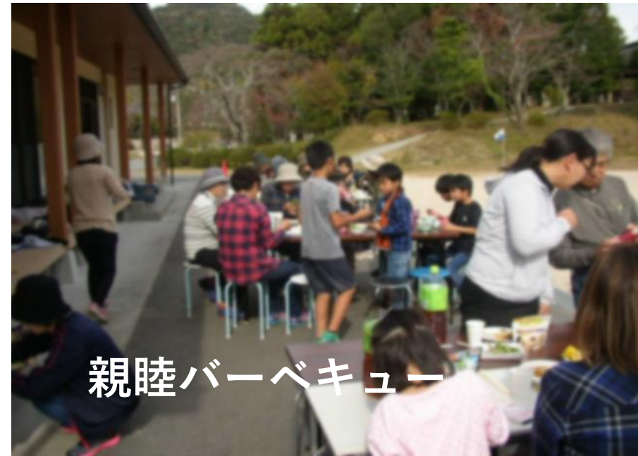
親睦バーベキュー