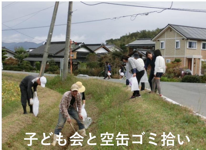
子ども会と空缶ゴミ拾い