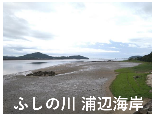
ふしの川 浦辺海岸