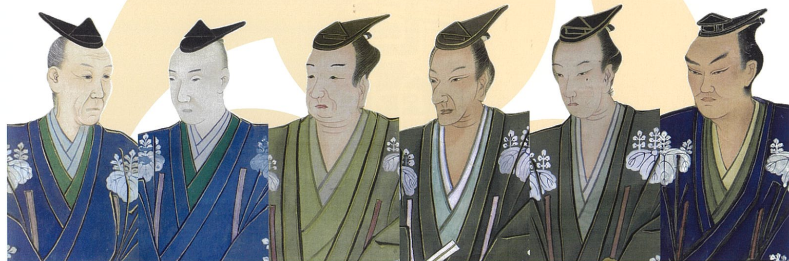
▲十三代・十五代 毛利元潔(元一)