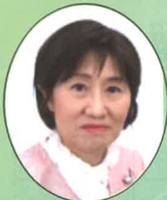
公立大学法人 山口県立大学学長