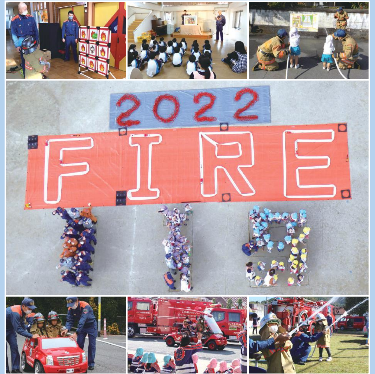
表紙写真：火災予防運動幼年イベント