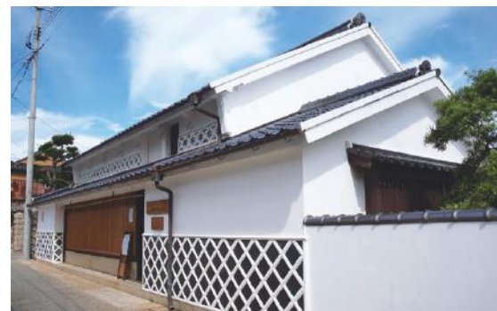
阿知須いぐらの館