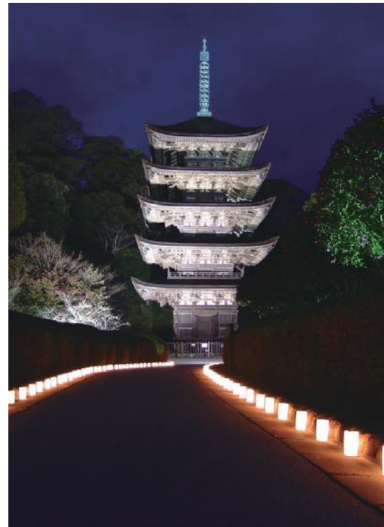
国宝瑠璃光寺五重塔