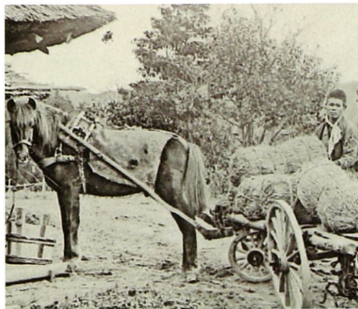
▲荷物を運ぶ馬(明治時代)

かつて牛馬は、人々の生活の中において身近な存在でした。例えば、農業では農具をつけられた牛馬が人とともに土を耕しました。