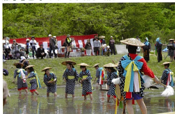
▲阿東徳佐の「はやしだ」風景(2014)