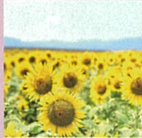
花の海 ひまわり畑

山陽小野田市は、山口県南西部に位置し、瀬戸内海に面した温暖な気候で、優れた自然環境、おでかけしやすい良好なアクセスを備えています。「スマイルシティ山陽小野田」で、あなたの笑顔、探しに来ませんか？