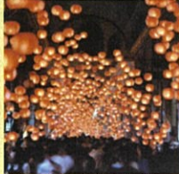
山口七夕ちょうちんまつり

山口市は、山口県のほぼ中央部に位置する豊かな自然や歴史が共存する文化都市です。海・山・街がちょうどいいのんびりと便利が同居するまち山口市で、自身のライフスタイルに合わせた暮らしを選択してみませんか？