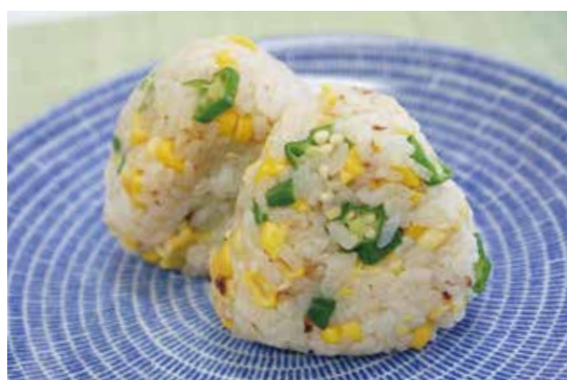
白石中3年 平本優さん考案 オクもろこしにぎり☆

【材料（4人分）】 米……………2合 昆布……………5 cm 角 とうもろこし……………1本 かつお節……………5 g オクラ……………10本 めんつゆ（ストレート） 酒……………大さじ2 ………………大さじ1 塩……………小さじ1