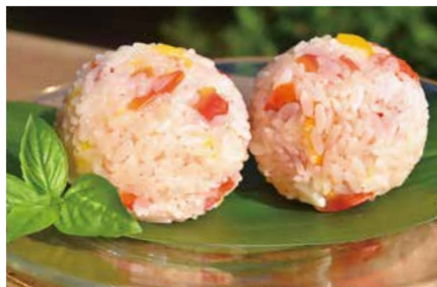
陶小1年 入江風さん考案 真夏の太陽のエネルギーを炊き込んだ トマトうめおにぎり

【材料（4人分）】 米……………2合 水……………250 ml トマト（赤・黄色）…200 g 塩……………小さじ1 梅干し……………1個 バジル……………適量