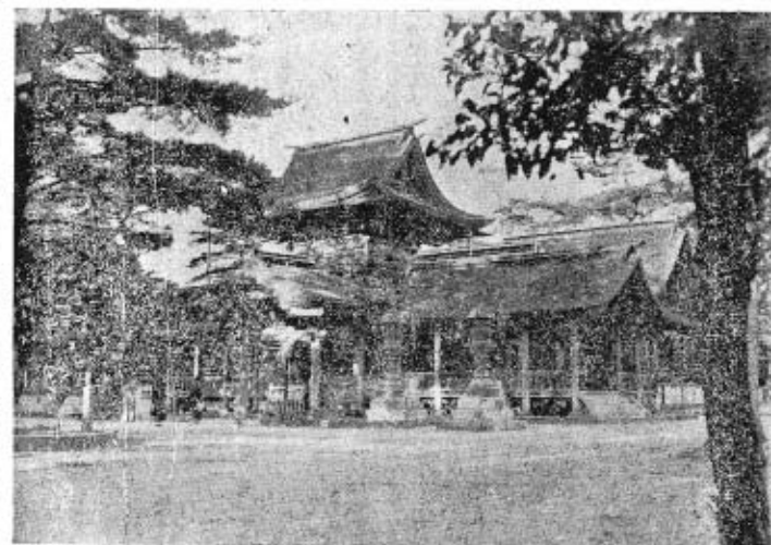
初詣にて 秋穂正八幡宮にて

昭和二十九年を過ぎ去り、この秋穂町の歴史と共に歩みだす。昭和二十九年の新春を迎え、回顧の筆を執り、心から新年の祝福を申し上げます。本年は天災の多い年であり、年初から不景気に陥り、秋穂町も例外不景気に陥り、秋穂町民の生活も苦しい。本年は天災の多い年であり、年初から不景気に陥り、秋穂町も例外不景気に陥り、秋穂町民の生活も苦しい。