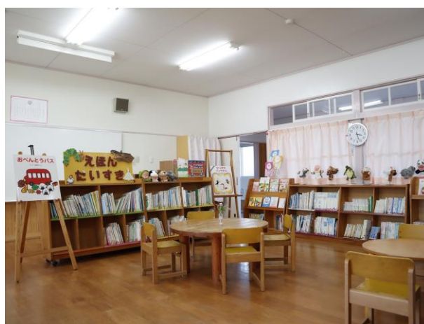
絵本コーナー（吉敷幼稚園）