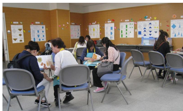
ボランティアと協働して開催する ブックスタート体験会（小郡図書館）