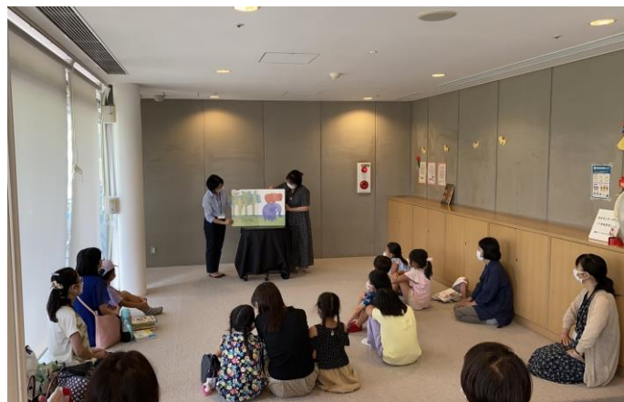
おはなしパレット（中央図書館）