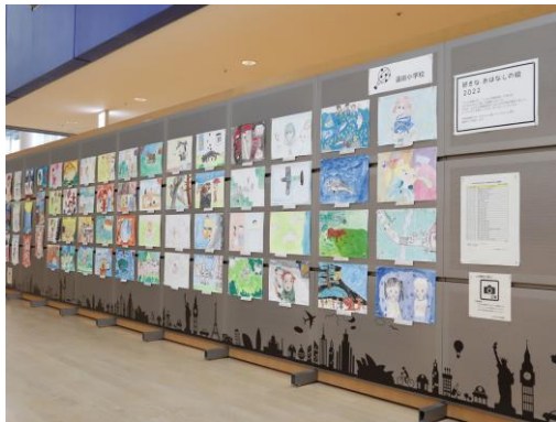
好きなおはなしの絵の展示（中央図書館）