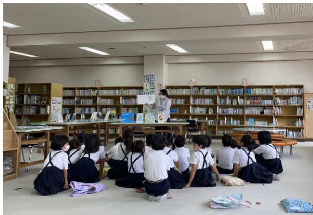
出前ブックトークと選書会（小鯖小学校）