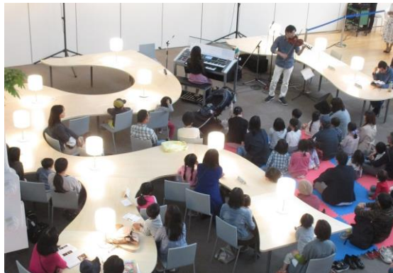
こどもワイワイ図書館 バイオリンとエレクトーンの音楽会（中央図書館）