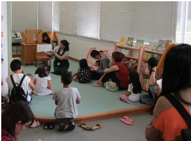
おはなしキラキラ（阿知須図書館）