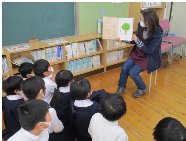
中央小学校での読み聞かせの様子