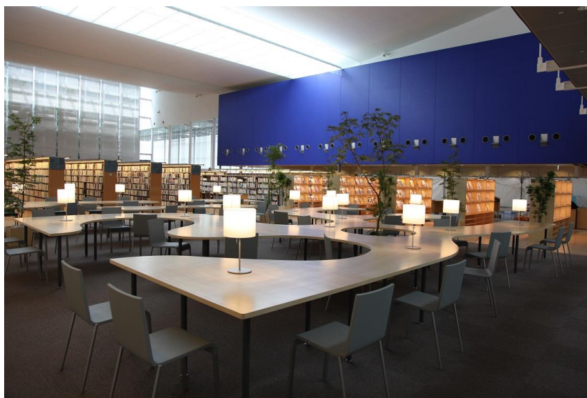
中央図書館の館内風景

また、第5章において、成果指標と目標値を設定し、その取組の進捗状況を総合的に評価して、計画全体の目的の達成度を明らかにします。