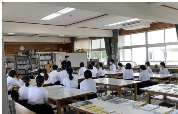
出前ブックトークと選書会（潟上中学校）