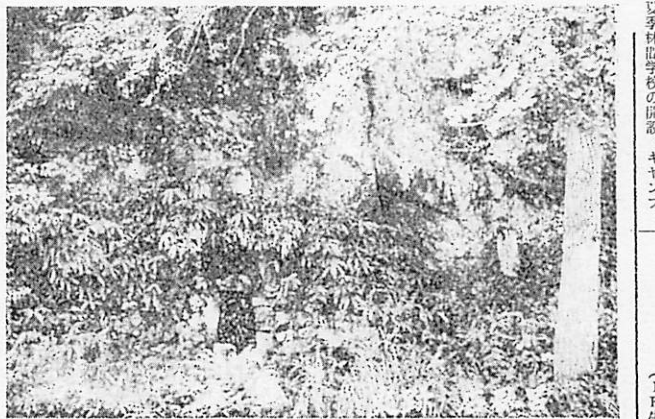
防石街道の遺跡として有名な野谷石屋の影を止める写真

り、得來は滑岩谷(秋の紅葉期は長門川にも勝る美観があるといわれる)をも含めて一大観光遊地化べく、その自然美はあまつきろく活用し、人工的には松、竹、つばきなどの植栽、水車、(マス、煙、ワカサギ)の装飾、アヒルの放飼場の誘致、キノコ、ジツク等を山間に放飼又は育成、夏休みに学校の開設、キャンプ、 休憩所、遊覧ポイント等々の施設が考へられて、既に今年中その一部は実施に移されたのである。これら諸施設が完備された際には山紫水明の一大観光遊地となし、山下にクロージングアップされる日も近き得來にあると思う。 アヒルは速かにかくあらん事を折つて下さい。(I.K.S.)