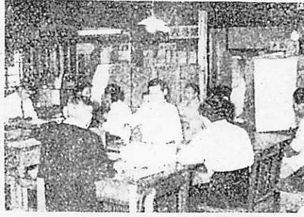
(写真は開票所の投票風景)

二大政党対立下初の参議院選挙は、割合冷静だったといえ、曰く、競争が平和か、改選が非改選か、暴力が議会政治を等閑視し、のきを削る選挙戦展開の中、愈々国民審判の日は遂に来た。当時は人口一九三三九名にして有権者は男五三〇二名、女五三九六名合計一〇六九八名にして、投票率は合計十九箇所、各投票所共前日より係員によつて用意万端整え、効率的に投票を待たせられた。引続いて県中学校に於いて午後八時より開票され、その結果地方区有効投票率、九九五票、無効投票率二六三票、無効投票率の主なるは候補者でない者の氏名を記したものが二〇三が最も多かった。二五票、無効投票率一、〇四二票無効投票率一四%にして、候補者でない者の氏名を記載したものが四六三票(全国区)単に記号符号を記載したものが二六票、白紙一八八票その他の順にして、その数字を科学的に検討すれば興味深いものがある。同時に得票の指針として諸問題の関心が提起せられていたといえよう。