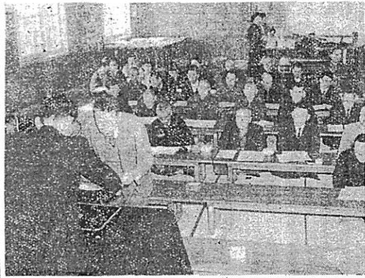
写真は、形を受ける優良組合長

「納税は日掛り、月掛り、心掛り、税金を合理的に納める方法として本町に納税組合が生まれ、五年になる。その優良な成績は、本年七月九日の好成績。町では三月三十一日午後一時から町公民館で二十九年度納税の納税組合表彰会が開かれ、路上十九年度優良組合として表彰された。優良組合として表彰されたのは、(一)青柳(一〇〇)且西(一〇〇)引野(九九)門松(九九)小東(九九)河内(九九)八(九九)岩上(九九)日東(九九)の十三組合である。