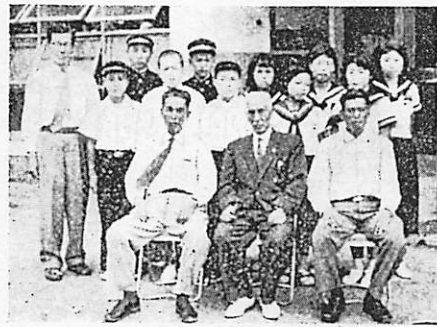
出発前の記念撮影