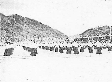
写真は堀中学校生徒のダンス

町内には小学校十一校、中学校五校ありますが、行事の一つである運動会の秋空の下に各校それぞれの特長ある秋季大運動会が行われ、十月十日の島地、