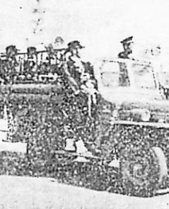
県大会に出場 気を吐く町消防団

山口県消防協会は、十月二、三日の両日、山口県消防大会および、山口県消防団大会の両大会を山口市中央公園で開催しました。