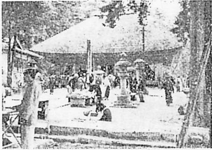
完成した月輪寺薬師堂