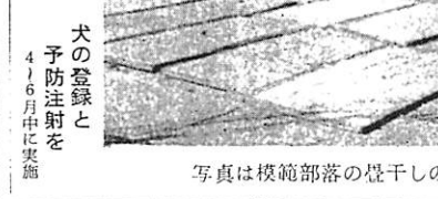
写真は模範部落の畳干しの状況