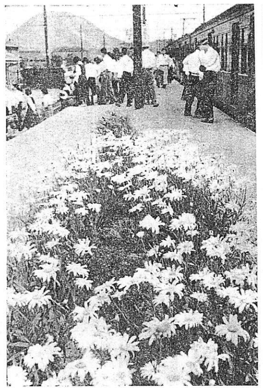
季節の花「マーガレット」がブラツ！ホームに咲きみ だれ、通勤、通学の朝夕や 旅行者の旅を憩んでいる (写真は阿知須駅にて)

来る七八日は参議院議員の通常 選挙の日であります。今度こそ 悔のない、正しい、美しい投票 を致しましょう。 「選べよわれらの代表」 これから参議院の性格と特色を かんたんに説明致しますので、こ の七八日に行われる投票の心構 えと材料として下さい。