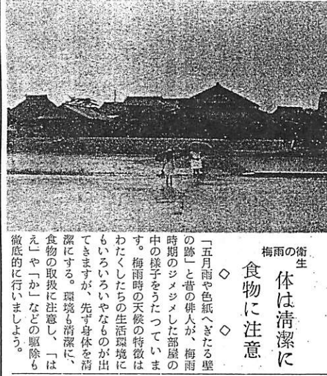
衛生 梅雨の体は清潔に 食物に注意

発行所 阿知須町役場 山口県吉敷郡阿知須町 発行広報委員会 編集 観光企業課広報係 印刷所 山口印刷KK TEL 259