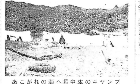
あこがれの海へ中学生のキャンプ