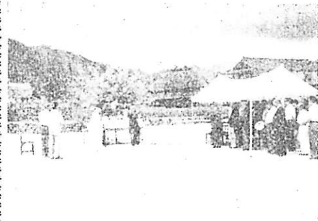
写真は八坂中学校の起工式

町立八坂中学校の雨天体育館と特別教室(二軒建)の建設は、さきの議会で定められ、八月七日入札が行われた結果、藤岡建設工業氏が、工事費一千百八十八万九千円で請負い、工事を進めることになり、その起工式が、八月十二日午前十一時より、現場において多敷町係者が集り、町長の「旗入り式」などおごそかに行われた。 なおこの工事は今年十二月二十日ごろ完成する予定である。 八坂中の工事については、中学校の永久建築工事も行われる予定で、目下その設計が急がれているが、これはみな「まづ教育の充実」をモットーとする町政方針の現れである。