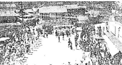
御成婚奉祝パレード 4月10日出雲地区婦人会、青年團、学生などが連合盛大な祝賀記念パレードを展開しました。

その他の各行政部門につきましても、それぞれの部門における行政、財政能力の均等調整を計り、総合的に町の置かれた立地条件を考慮し、町政の推進に努めます。