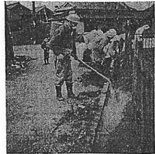
蚊の幼虫、蛹の絶好の住居である溝は先づドベを揚げ排水を完全にし、薬剤撒布