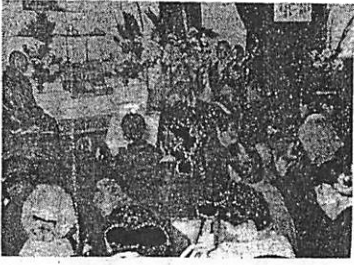
第八回 慰靈祭 挙行

昭和三十三年度決算による赤字額をどうにかして... 温泉売却... 町財政再建は6年で！