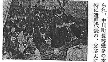
戦死者慰靈祭は十一月十九日ラジウム温泉で行なわれた。