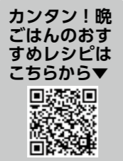
カンタン! 晩ごはんのおすすめレシピはこちらから

市ウェブサイトにて、食事づくりに役立つ簡単レシピ動画「カンタン! 晩ごはんのおすすめレシピ」を掲載しています。ぜひご視聴ください。6月は食育月間です。この機会に、簡単レシピで料理を作ってみませんか。