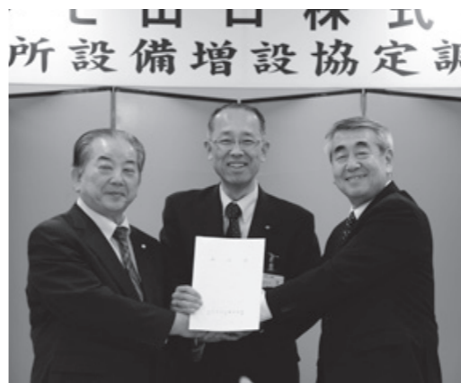
テルモ山口との調印式