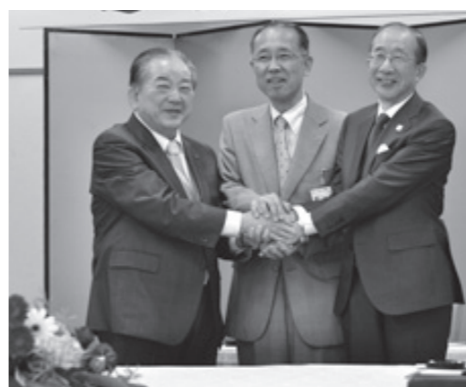
スターライト工業との調印式