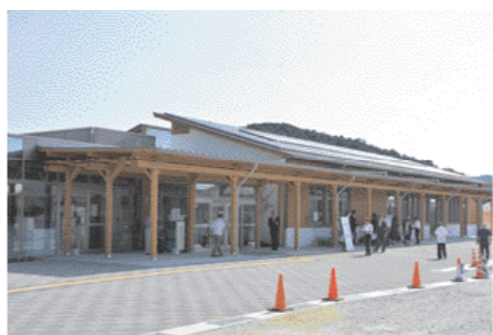
【写真5】 平屋建てで、市内木材を使用した暖かみのある陶地域交流センター

7月 阿東総合支所に資源物ステーション開設、地域おこし協力隊山口隊員に委嘱状交付(1日) / 参議院議員選挙から「18歳選挙権」適用(10日) / 観光アンバサダーとして大学生4人を委嘱(13日) / 駐日スペイン特命全権大使ゴンサロ・デ・ベニト氏らが本市視察(20日) / 中原中也記念館の特別企画展「太宰治と中原中也」と「文豪ストレイドッグス」のコラボレーション開催(28日)