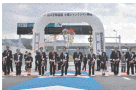
【写真3】 山口宇部道路小郡ジャンクション開通式

4月 レノファラッピング列車運行開始(2日) / 平成28年熊本地震の被災地へ緊急消防援助隊らが出発(16日) / 熊本県宇城市へ支援物資発送(22日) / 全国健康保険協会山口支部と健康づくりの推進に向けた包括的連携に関する協定締結(28日) / カニエ・ナハ氏が第21回中原中也賞受賞(29日)