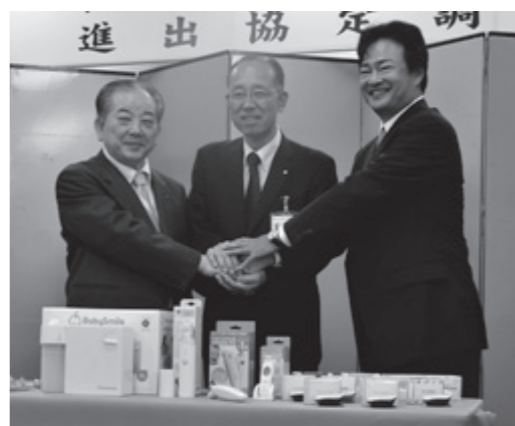
シースターとの調印式

株式会社(本社東京都港区)、スター ライト工業株式会社(本社大阪府大 阪市)、株式会社テレマーケティング フォース(本社東京都港区)です。ま