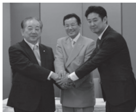
テレマーケティングフォースとの調印式