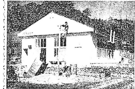
竣工した八坂小の給食室