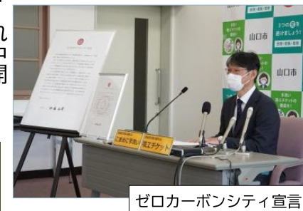
ゼロカーボンシティ宣言