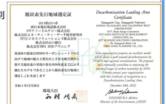
脱炭素先行地域選定証