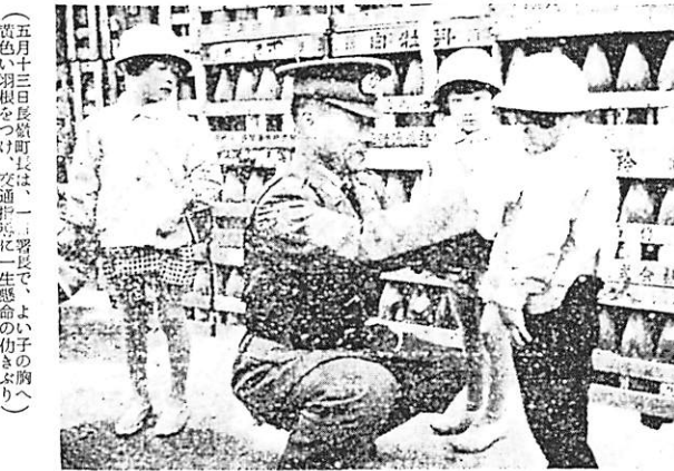
(五月十三日町長署長は、一習いで、よい子の胸へ) 黄色い羽根をつけ、交通指導に一生懸命の坊や(り)