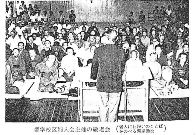
郷学区区婦人会主催の敬老会 (老人にお祝いすることば) をのべる要寮助役