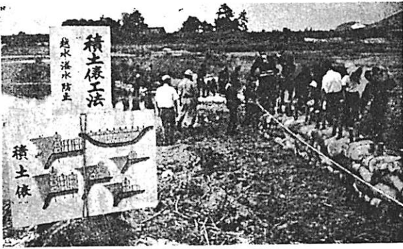
写真は町消防団員の工法

7月21日防府市右田地区、大崎橋附近で、県の総合防災訓練が行われ、町消防団員20名も応援出場し積土工法に活躍しました。