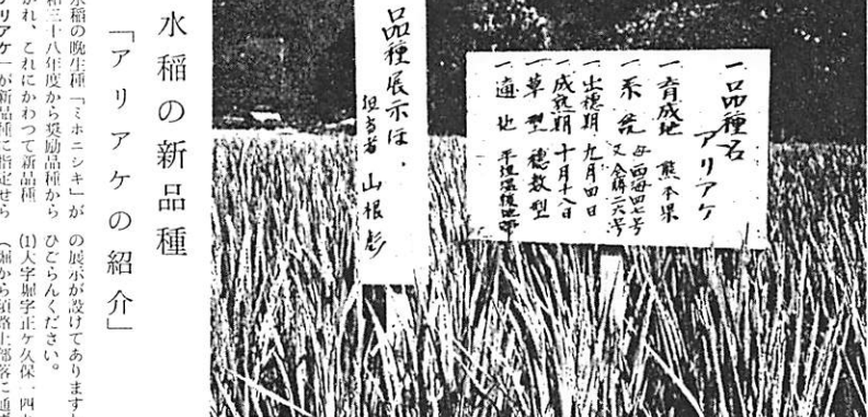
写真は新品種アリアケの採種は

「アリアケ」の栽培が盛んであります。昭和三十一年度から奨励品種から「アリアケ」が新品種に指定せられ、(稲)から須路上落通する道路に植付した。