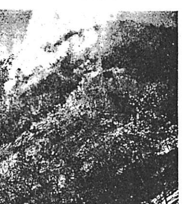
山火事の追放に協力ください

最近、連日のように気象が荒れ、町づくりに妨げのため、お互いに「異常気象注意報」がだされておりました。毎日の朝報には、大がく山火事、家庭火災のニュースを伝えてあります。 すべの火災のはんどの原因が「人の不注意」による場合が非常に多いのです。外国人にいわせると、日本人は、屋外で火を焚くことを好む人間ではないとい