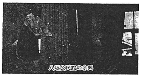
八坂公民館の余興