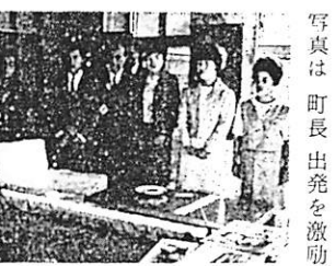
写真は町長出発を激励

先進地視察 激動大会を終えた青年達はさらに、視察研究を行って視野を広めるとともに、バス旅行宿泊など集団行動による仲間づくりを行い、今後の農業に対する希望と意欲を高めるため