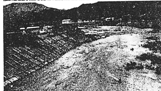
進む建設譜 (上) 県道山口〜都濃線の一部改修 (伏野) (下) 島地川沿岸 (須路側) の工事現場を写す