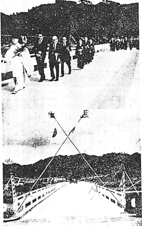
(上) 渡り初め式の状況

関係地域の方々が多年待ち望んでおられた〔新田橋〕が、さる9月29日午後3時、開通式が挙行されました。同橋は、昨年9月建設省に委託着工し、総工費4,220万円をかけて、富士製鉄、石丸工務店、河内組、KK山商の手で施工され、このほど完成したもので、山口を結ぶ最短距離として将来大きく貢献することでしょう。