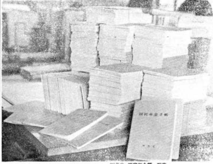
写真説明 こんなに手帳が町役場に届いて皆さんのお手紙に届く日を待っています