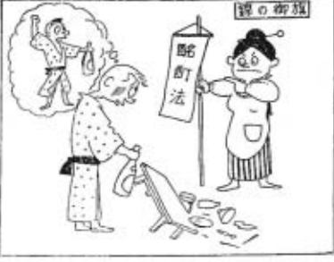
酒をのんでいたからという言訳は今後通用いたしません。お酒は適量におのみ下さい。