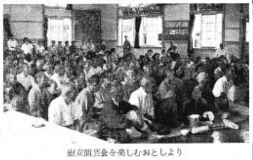
慰安演芸会を楽しむおとしより