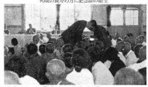
90歳の長寿の方に記念品の贈呈