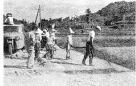
遍明院の舗装工事