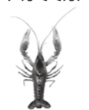
▲アメリカザリガニ

アメリカザリガニとアカミミガメの飼育や、個人間での無償譲渡は引き続き行うことができますが、野外に逃がす・放す、輸入、販売、購入、広く配ることを目的とした飼育などが規制されます。