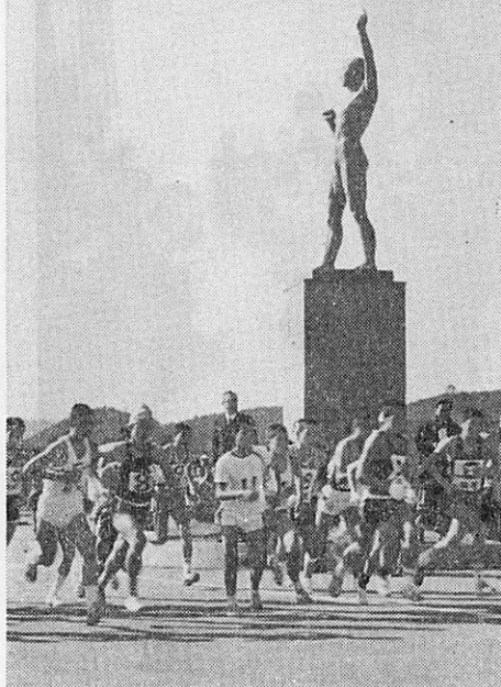
中学駅伝 第22回山口県中学駅伝が、吉敷の陸上競技場外周コースで、県下25チーム、200人が参加して行なわれ、大島チームが優勝、山口チームは第10位でした。

山口市は古い歴史を持つ町だけに、市内に文化財も多く、国宝瑠璃光寺の五重塔をはじめ、七十一も指定文化財があります。これらの中には、自動火災報知設備や消火設備が設置されているものもありますが、これは万一の火災に備えたもので、これがありさえすれば万全だとは言いきれません。一番たいせつなことは、なんといっても、市民の皆さんの、文化財に対する認識と、文化財を愛する心です。