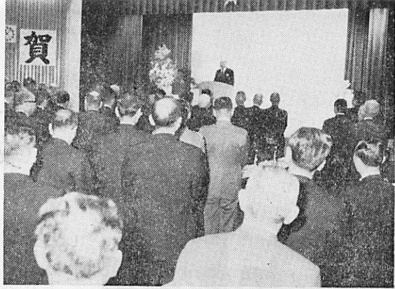
市民新年互礼会 元旦の11時、市民会館小ホールに約300人の市民が参会、新しい年と山口市の発展を祝いました。