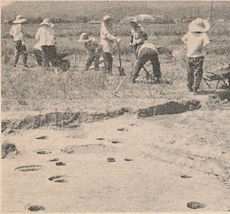
奈良時代につくられた貨幣のほとんどは、この周防鑄銭司でつくられたといわれます