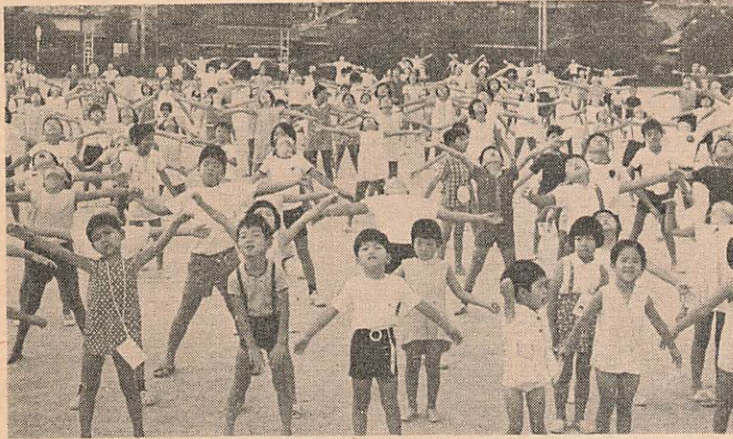
夏の朝はラジオ体操で始まる——7月21日白石小で

子どもたちには一年中でいちばん楽しい夏休みです。みんな元気に楽しくやっていますか。 解放感からあふないところに行ったり、夜遅くまで遊び歩いたり——ということのな