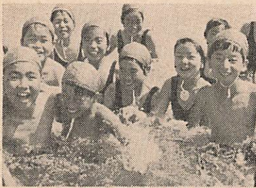
プールで水しぶきを上げる児童

から、軽やかにラジオ体操の音楽が聞こえてくる夏の朝。子どもたちがオイチニ(おとなが少ないのでちよっぴり淋しい)。夏の朝はラジオ体操で始まり、炎暑の下で球技大会の練習に汗を流す。おとなもソフトやバレーボールの大会が各地区で行なわれています。市