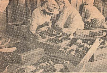
盆を過ぎると山口ぶどうの収穫は最盛期に入る