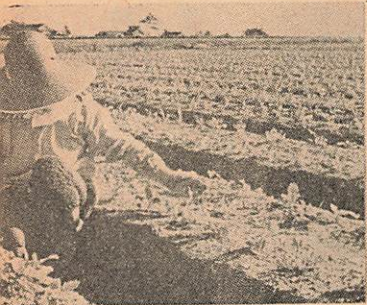
適当に雨も降り、生育順調 なだいこん畑。

・スローガンを——『来年は公民 館建設二十周年。これからの公 民館活動、村づくりのあり方を みんなで考えよう。一人一提案 案をしよう。そしてこれが 佐山のねがいくという、キャッ チフレーズをつくろう』