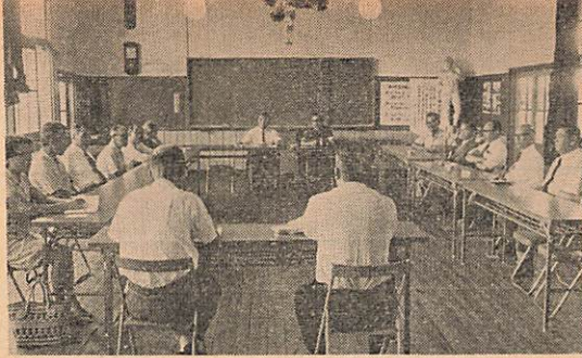
子どもにやさしい気持ち、を傾け 展望を語る公民館 運営審議会

ため池 地区内にある河川 とはいえ土路石川ぐらいのも ので、出口、河原谷、新堤は かたくさんのため池が農業用 水役を果たしている。