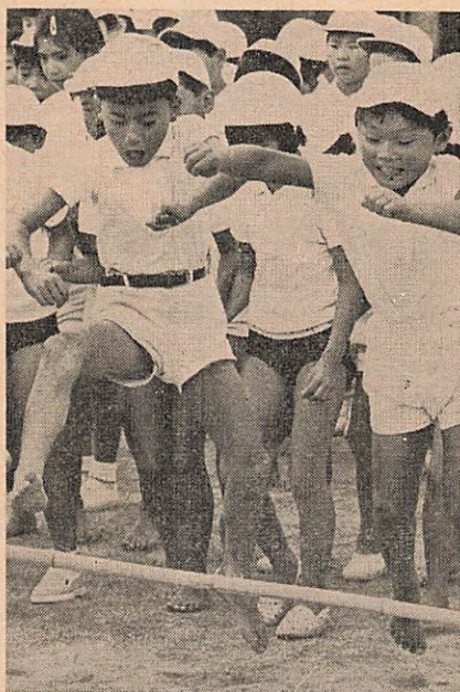
スポーツのある暮らし 習慣化こそたいせつ